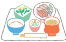
栄養バランスの良い食事

口内炎で最も一般的なアフタ口内炎は、確かな原因はわかりませんが、からだの免疫力が低下した時に、口の中の細菌によって引き起こされたり、胃腸などの内臓障害が主な原因と考えられています。予防法としては、栄養バランスの整った食事を心がける。睡眠をしっかりと、ストレスを溜めない。普段から正しいブラッシングを心がけ、お口の中を清潔に保つなどが大切です。